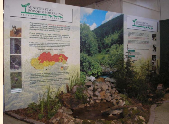
Slovenská agentúra životného prostredia